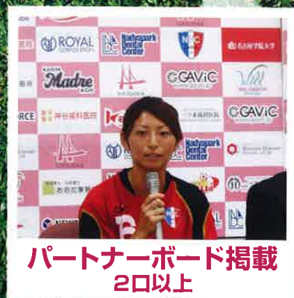
パートナーボード掲載 2口以上